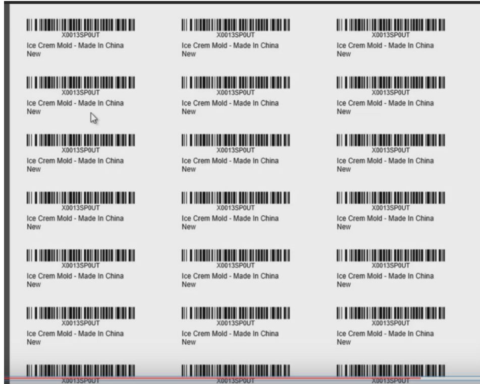
איור 3: ברקודים למוצר